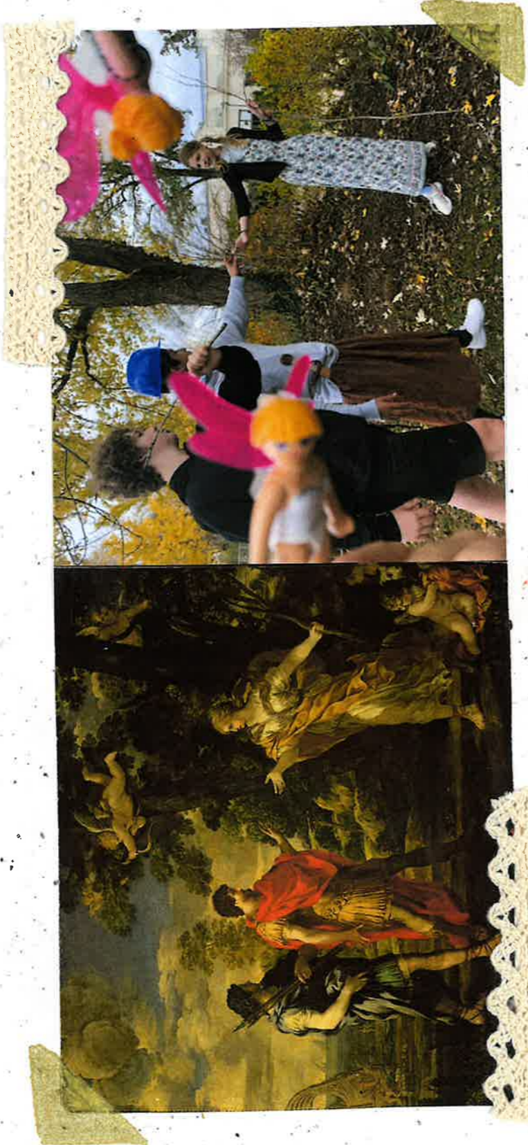
Œuvres appartenant à Enée, Pierre de Cortone, 1625