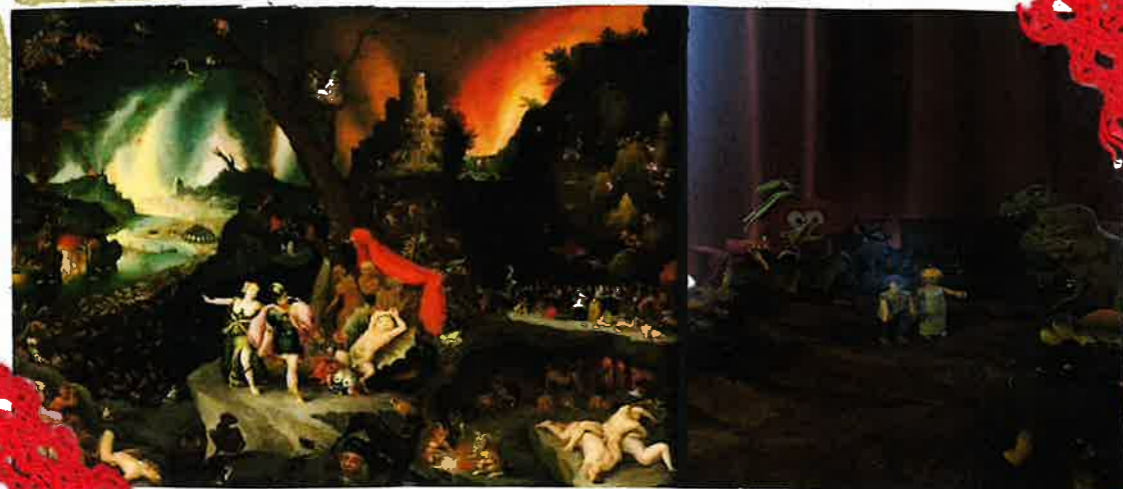
Enée et la Sibylle aux Enfers, Jan Brueghel l'ancien.