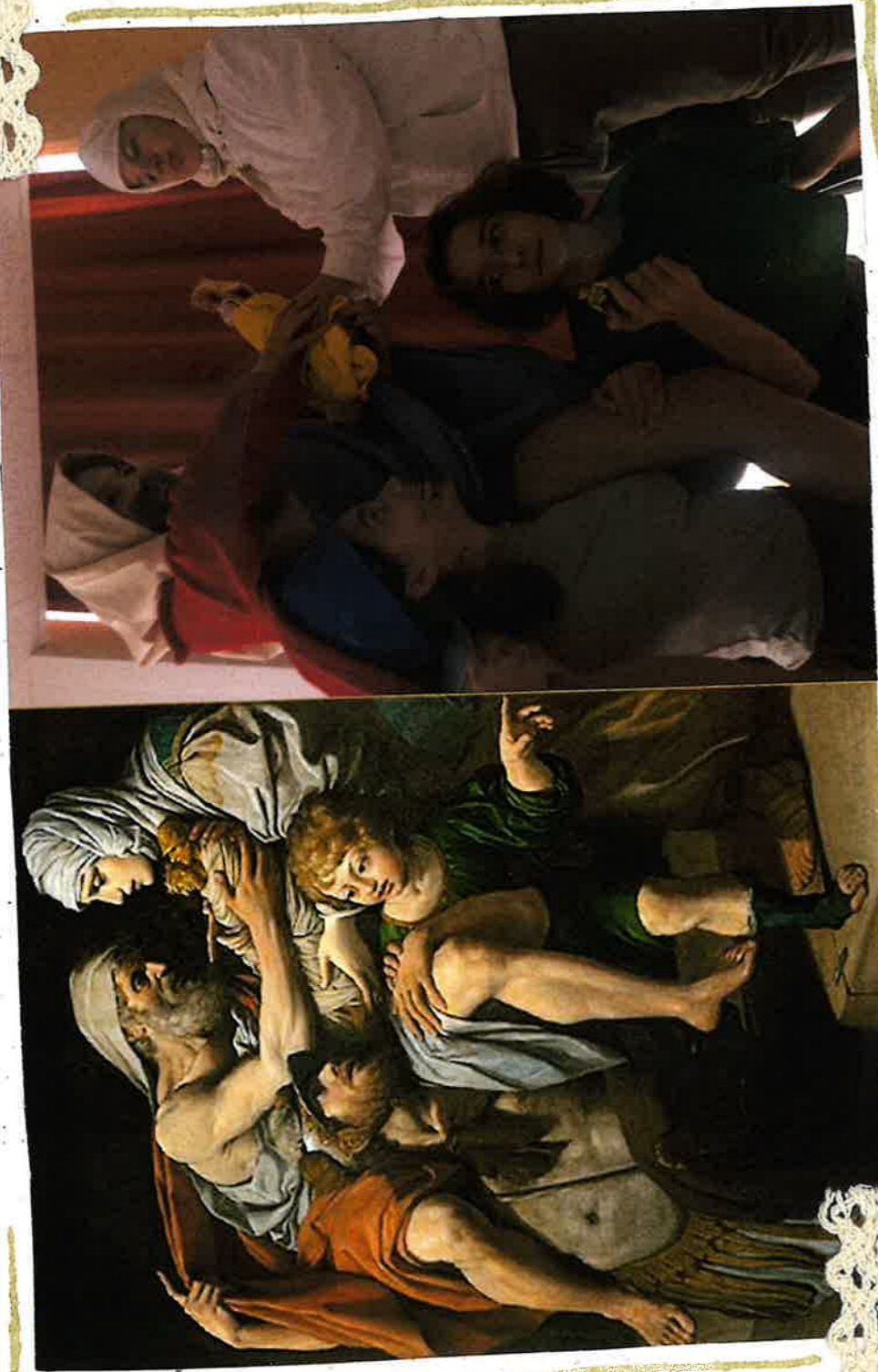
Chât et Tchahé, Lamello Spador - 625

Les parents nous impitent et l'éléme augurium pateset.