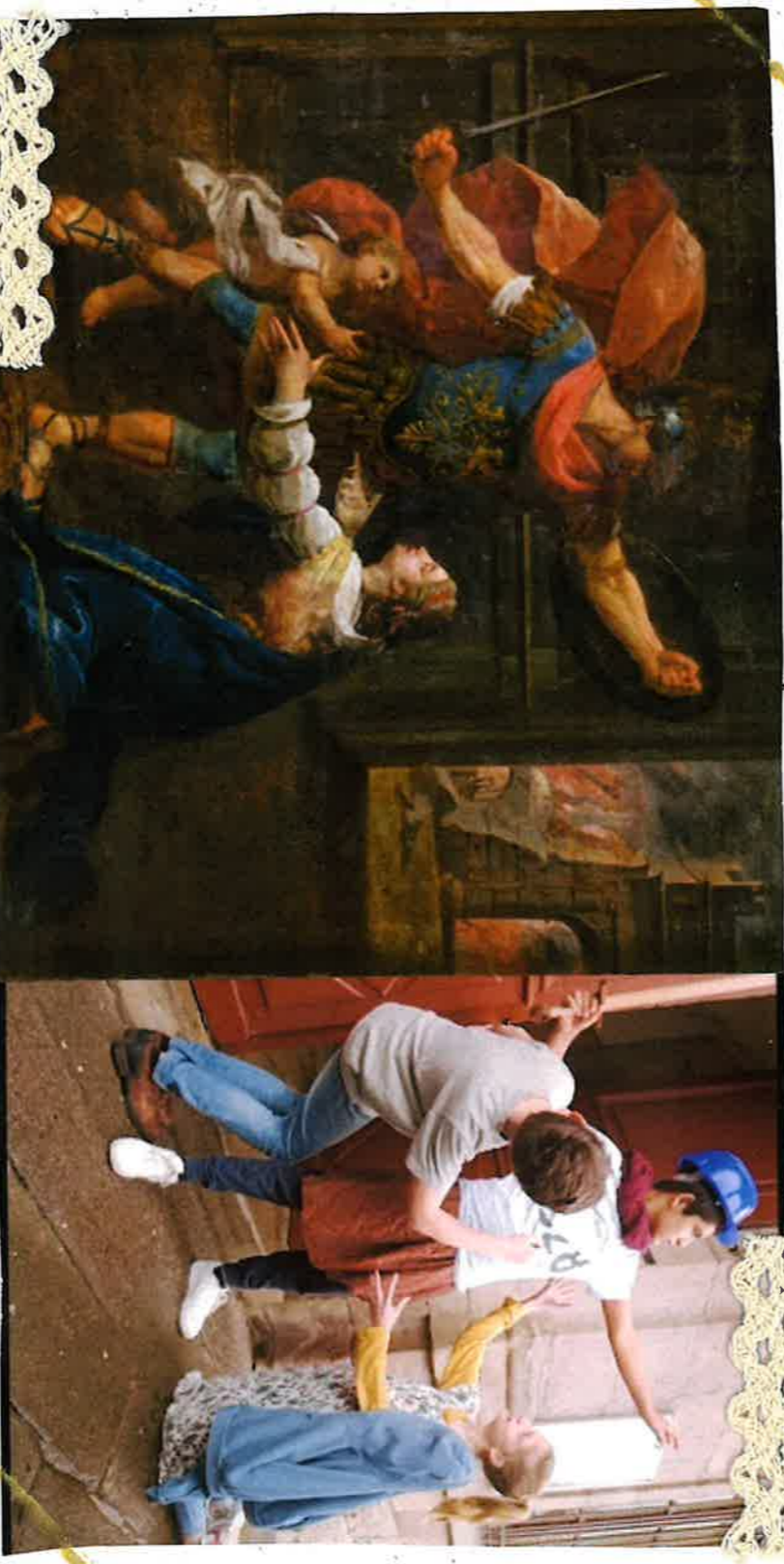
Enlèvement des Sabines, 1494 C.