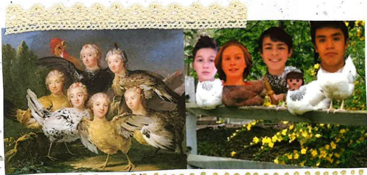
Représentation de Harpies,