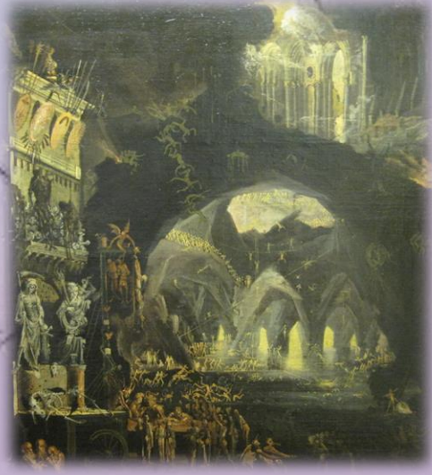
Les enfers, François de Nomé, vers 1610, Musée de Besançon

Enée doit descendre aux Enfers, comme beaucoup de héros avant lui. Ce type de mythe s'appelle une catabase et est souvent un passage initiatique important, qui permet d'accomplir son destin. Enée y apprend que ses descendants vont fonder Rome, il y revoit aussi son père Anchise, et son amour perdu, Didon, qui l'ignore.