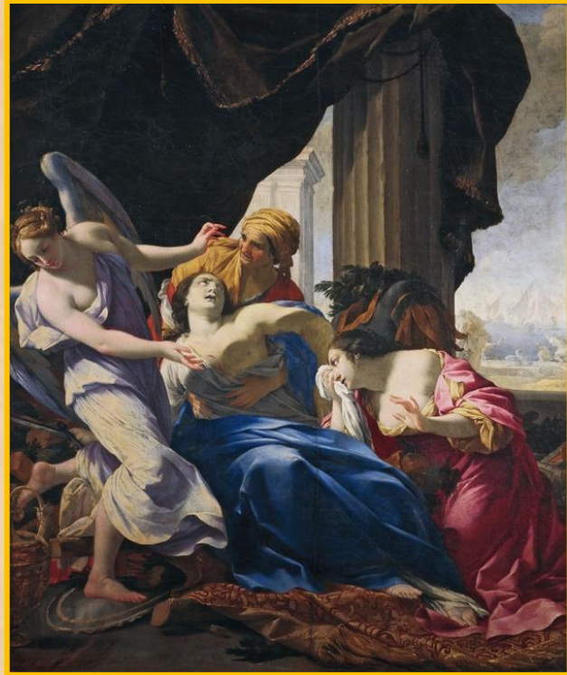
La mort de Didon, Simon Vouet, vers 1642, Musée des Beaux-Arts de Dol

In Carthage, offendit meum amorem magnum; Erat Dido. Iactatus sum lito Lybie et Didonem offendui. Regina illustra erat quae Carthage condidit. Dido me amavit propter Cupido. Sichem, sum sponsam, obtulit est sed Dei me iusserunt abire et eam reliquere.