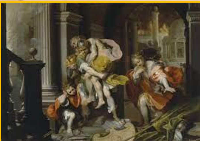
La Fuite d'Énée, Federico Barocci, 1598, Rome, Galerie Borghèse