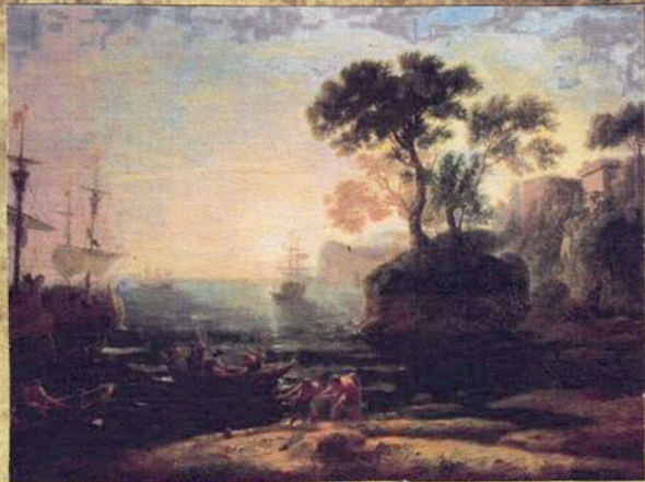
Arrivée d'Énée en Italie, l'aube de l'Empire romain Claude Lorraine dit Le Lorrain 1635-1640?