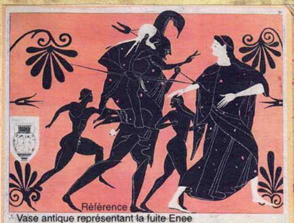
Référence Vase antique représentant la fuite Enee

Amphore (vers 520 av. J.C.) Château-musée, Boulogne-sur-Mer