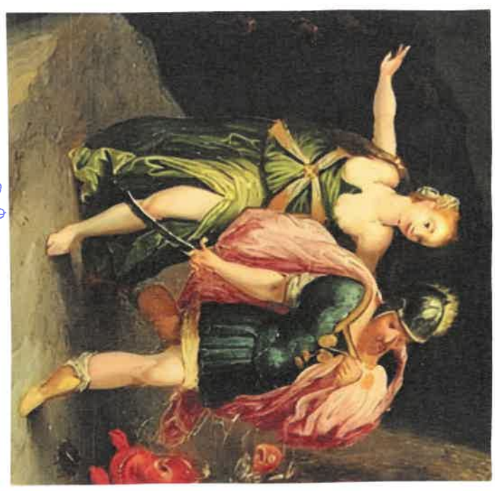
Enée et Sibylla aux Enfers