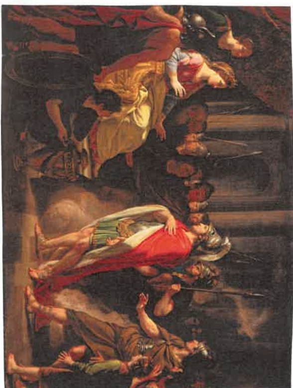
Didon et Énée de Henry Bunell.

Aeneas clarissimus est vir Troianus idemque pater Romae