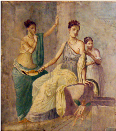
Heracles ivre et Omphale. fresque antique. Pompéi